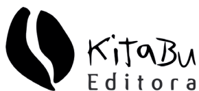
ILUSTRAÇÃO: PRISCILA PAULA